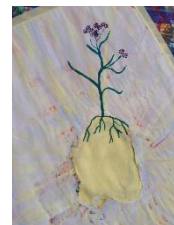
Bilder aus der Kunsttherapie